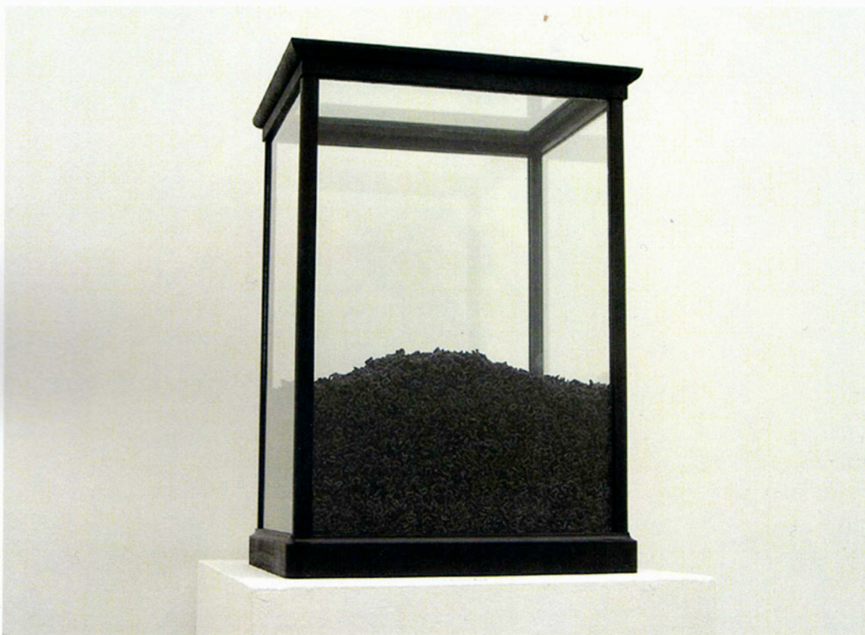
Maïder Fortuné, Characters/Hamlet , 2008, technique mixte, œuvre unique. Courtesy Maïder Fortuné et galerie Martine Aboucaya, Paris.

Dans l'exposition « Whispering in distant chambers 1 » en mars 2008, Maïder Fortuné présentait à l'intérieur d'urnes transparentes bordées de noir toutes les répliques d'Hamlet, d'Antigone ou du docteur Faust dans les pièces de théâtre éponymes. L'artiste avait en effet décomposé chaque phrase, dans les textes originaux, en autant de lettres représentées par le nombre exact de pâtes alphabet teintées en noir qui remplissaient partiellement les boîtes rectangulaires. Juliette 17366 , exposé 2 à côté du Roméo 19284 inévitablement as-