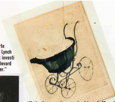
"Un landau croqué par un des frères de Marcel Duchamp, comme pour rappeler ma première aventure professionnelle : la marque pour enfants AirdeJe."