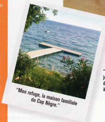
"Mon refuge, la maison familiale du Cap Nègre."

"En musique, je suis très éclectique : de Radio Head à Bashung."