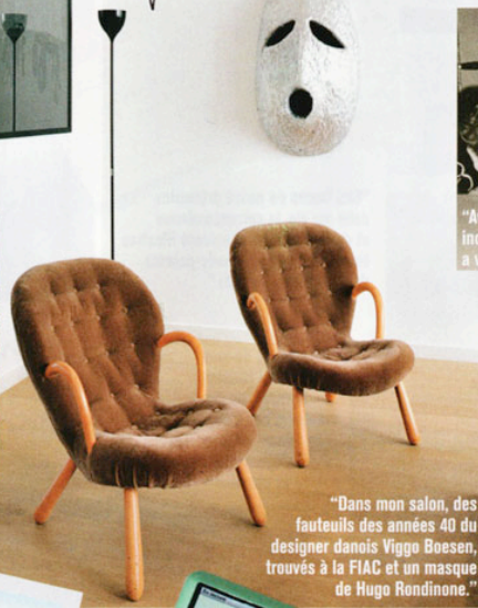
"Dans mon salon, des fauteuils des années 40 du designer danois Viggo Boesen, trouvés à la FIAC et un masque de Hugo Rendinone."