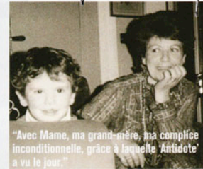
"Avec Mame, ma grand-mère, ma complice inconditionnelle, grâce à laquelle 'Antidote' a vu le jour."