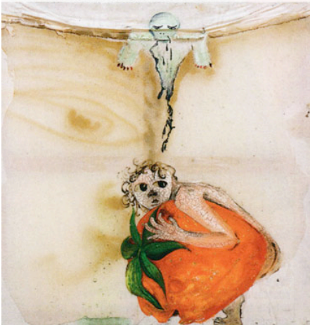
"Moi la fraise", un tableau de Marlène Moquet. J'aime son inspiration qui navigue entre naïveté et étrangeté."