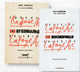
"La passion pour le russe de mon arrière-grand-père l'a amené à traduire le livre où il raconte sa vie, du monde des affaires à l'épreuve de la déportation."